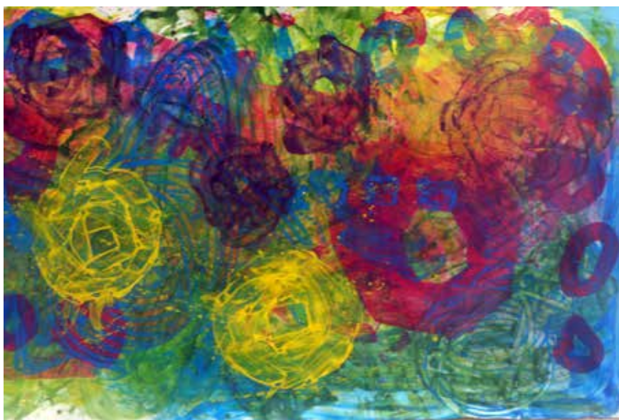
Titulo: Materia flotante pi. Técnica: Acrílico sobre lienzo. Medidas: 80x60cm. Año: 2009.