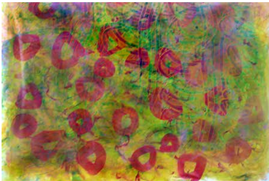
Titulo: Materia flotante tú. Técnica: Acrílico sobre lienzo. Medidas: 60x45cm. Año: 2009.