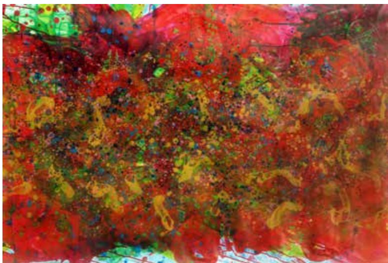
Titulo:Pulsa. Técnica: Acrílico sobre lienzo. Medidas: 140x90cm. Año: 2009.