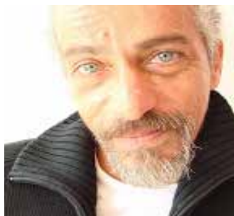
MiarmaciOn-(oz), Por Beatrix Isolina (2009)

potreritos_62@yahoo.com y fernandezmario186@gmail.com