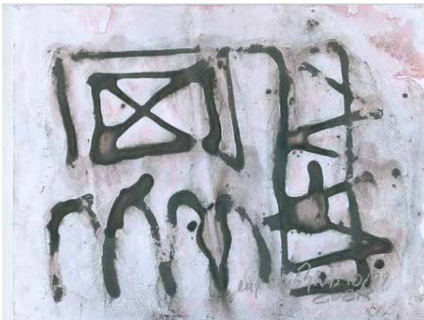
Titulo: Ducha uan. Técnica: Mixto sobre papel. Medidas: Tamaño carta. Año: 2010.