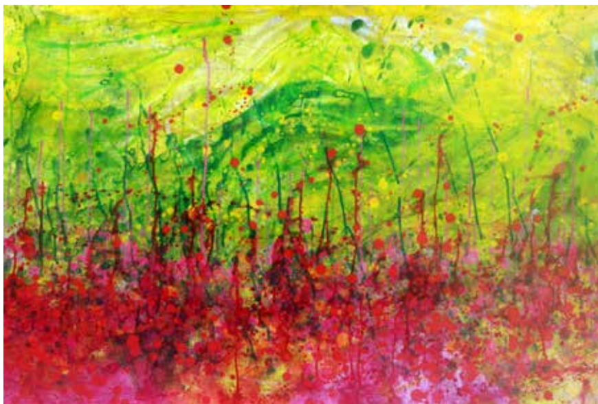
Titulo: Adiós Berlín. Técnica: Acrílico sobre lienzo. Medidas: 140cm x 90cm. Año: 2009.