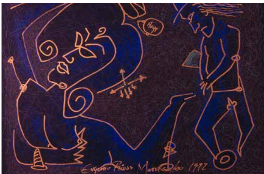
Titulo: Callejeando. Técnica: Creyón y tinta sobre cartulina de hilo. Medidas: Medio pliego. Año: 1992