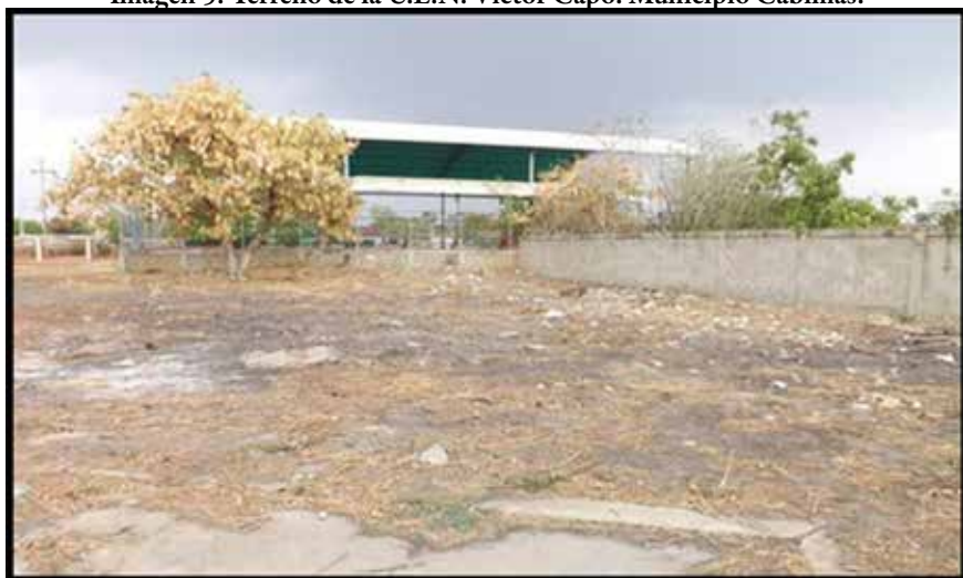
Imagen 5: Terreno de la U.E.N. Víctor Capó. Municipio Cabimas.

En la imagen 4 se puede observar el espacio inutilizado el cual puede ser habilitado para el desarrollo de ciclo de lectura de poesía al aire libre, permitiendo una inspiradora en los estudiantes. De esta manera, es posible desarrollar las capacidades personales artísticas, aplicando estrategias diferentes que puedan hacer sentir al estudiante más liberado en proceso de aprendizaje.