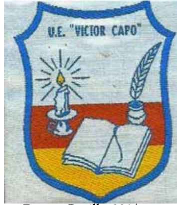
Imagen 2: Insignia de la U.E.N. “Víctor Capó”