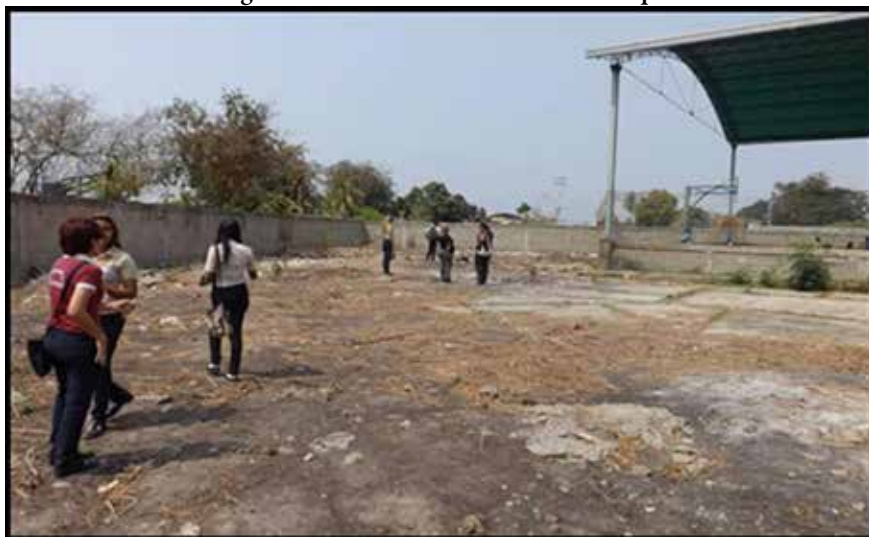
Imagen 7: Terreno de la U.E.N. “Víctor Capó”.

En la imagen 6 se muestra el espacio inutilizado, que puede habilitarse para el arte y pintura creando murales históricos fomentando la historia local. Lo anterior propiciaría un sentido de pertenencia y conocimiento histórico en los estudiantes a su vez desarrollando sus habilidades artísticas.