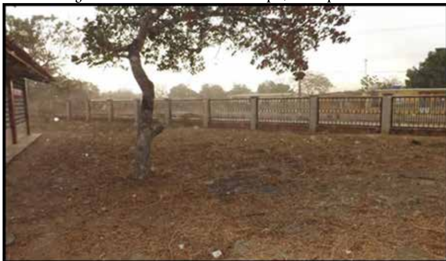
Imagen 4: Patio de la U.E.N. “Víctor Capó”, municipio Cabimas.

Ahora bien, la propuesta nace en la Unidad Educativa Nacional “Víctor Capó” pero tiene mirada a todas las instituciones educativas del municipio Cabimas que se encuentre en igual estado y permitir el desarrollo de los estudiantes y así contribuir a la construcción de la sociedad que realmente queremos considerando las palabras de Pepe Mujica “El puente entre el hoy y el ese mañana que queremos tiene un nombre y se llama educación”. De esta manera, estructurar las relaciones históricas necesarias para la sociedad y espacio geográfico socialista con una visión endógena, construida entre todo(a)s con el pleno desarrollo de la batalla de ideas impulsada con el motor “Moral y Luces” cuya esencia es la de convertir a Toda la Patria Una Escuela, y la educación en todo lugar y con todo(a)s, permita alcanzar y aprehender nuevos valores.