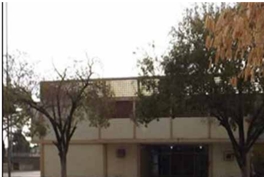
Imagen 1: Entrada de la U.E.N. Víctor Capó, municipio Cabimas.

En el año escolar 1975-1976, se crearon dos secciones de segundo año y dos terceros años. En marzo de 1976, por decreto presidencial lleva por nombre en honor a un insigne maestro no nacido en Cabimas, pero que dedicó toda su vida a nuestra ciudad Cabimas “Víctor Capó”.