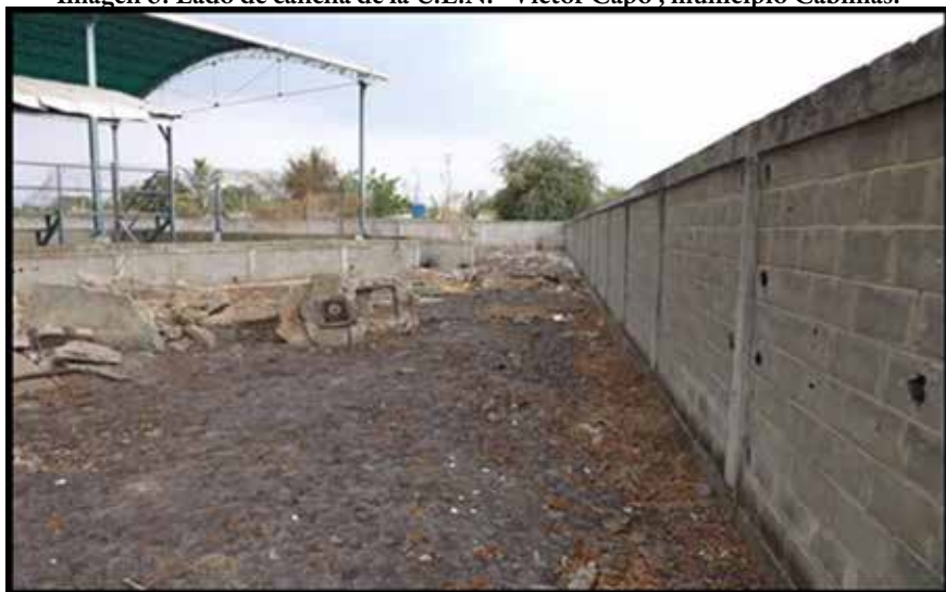
Imagen 6: Lado de cancha de la U.E.N. “Víctor Capó”, municipio Cabimas.