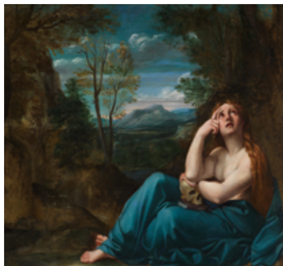
Fig.5. María Magdalena en un paisaje. Annibale Carracci. Ca. 1599. Fitzwilliam Museum, University of Cambridge, Cambridge (Reino Unido).

Por todo lo mencionado, se trata de un llanto de arrepentimiento y tristeza.