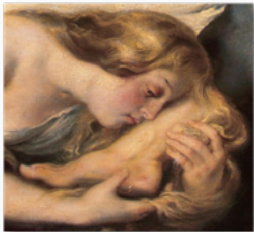
Fig. 2. Fiesta en casa de Simón el fariseo. Peter Paul Rubens. Detalle de la figura 1.

Un llanto de penitencia con el que la <<pecadora arrepentida>> sirvió de modelo para los pecadores y aquellos que hacían suyos los pecados de otros: