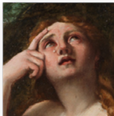
Fig. 6. María Magdalena en un paisaje. Annibale Carracci. Detalle de la figura 5.

Fig.5. María Magdalena en un paisaje. Annibale Carracci. Ca. 1599. Fitzwilliam Museum, University of Cambridge, Cambridge (Reino Unido).