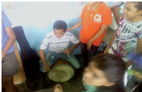
Figura 3. Grupo de tamboreros en honor a San Benito.