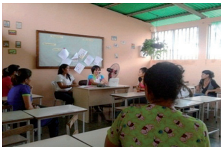
Figura 6. Conversatorio los proyectos de aprendizaje y los saberes populares

con el fin de fortalecer la integración escuela-familia-comunidad pero esto se logra en la medida que respondan a las necesidades, realidades e intereses de los estudiantes pero a la vez procuren proyectar la riqueza de los saberes populares propios de la comunidad.