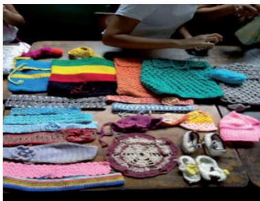
Figura 8. Exposición de muestras de tejidos.

Los investigadores determinaron que es de suma importancia incorporar estos saberes al quehacer educativo sobre todo en la planificación diaria del docente, de esta forma se integran los pilares y ejes integradores para fomentar el interés creativo de cada estudiante, favorecer la triada escuela-familia-comunidad al desarrollo de las actividades pedagógicas. Después de culminado el encuentro pedagógico- comunitario, se realizó una exposición con todos los enseres elaborados por los estudiantes.